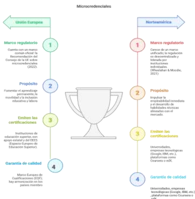
Figura 1: Aspectos diferenciadores entre la UE y Norteamérica

Nota. European Commission (2022) y Wheelahan, L., & Moodie, G. (2021)