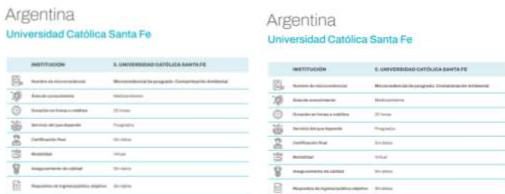
Figura 4: Microcredenciales que perfilan las universidades latinas

Los microcredenciales que se han sido propuesta por universidades latinoamericanas y que sobresalen son los siguientes: