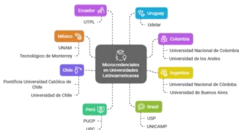
Figura 3: Implementación de microcredenciales en Latinoamérica

Nota. Elaboración propia en base a informe OEI, 2024