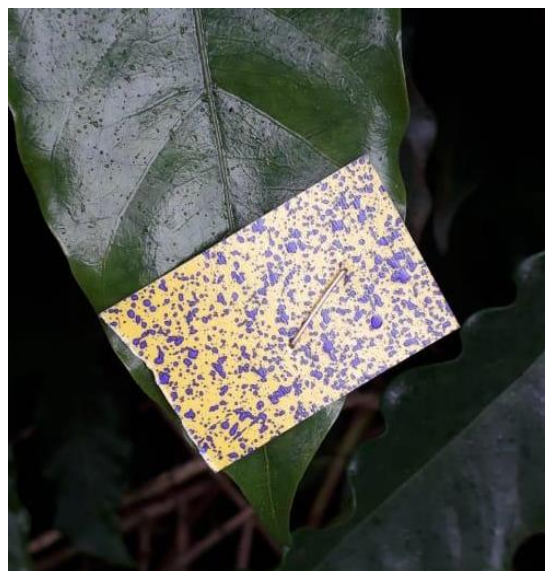
Figura 2. Cobertura total com utilização do papel hidrossensível. Fonte: Os autores