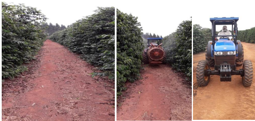
Figura 1. Pulverizações realizadas à campo.

O experimento foi realizado na Fazenda Triunfo, localizada no município de Três Pontas, em uma área com uma lavoura do cultivar Mundo Novo 476/4 com seis anos de idade, em maio de 2019. As pontas de pulverização utilizadas foram da marca Jacto, com vazão constante de 400l/ha e tomada de força de 540 rpm. As pulverizações (Figura 1) foram realizadas em condições de campo, utilizando um pulverizador da marca Jacto Arbus® 400, com 16 bicos com água como calda e os produtos pulverizados.