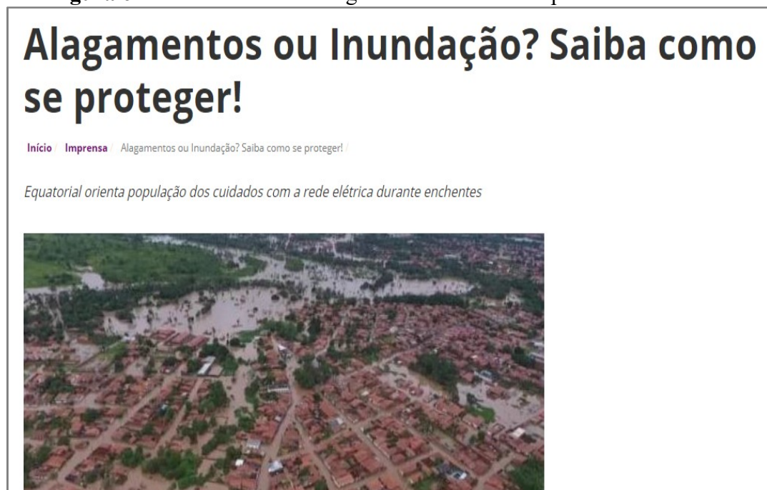
Figura 6- Fornecimento de energia cortado em municípios do Maranhão