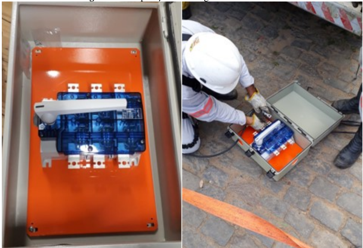
Figura 10 – Preparação e montagem do seccionador de BT