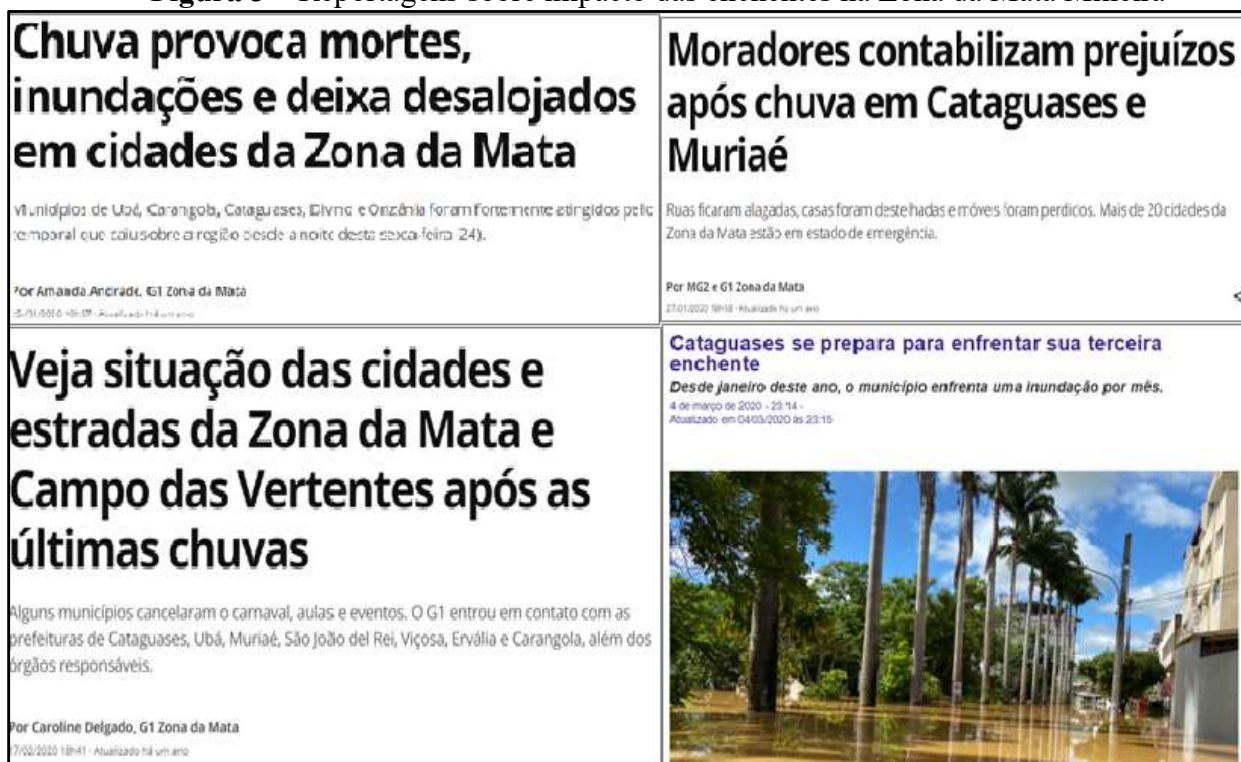
Figura 3 – Reportagens sobre impacto das enchentes na Zona da Mata Mineira

Fonte: Compilado e adaptado pelos próprios Autores 1