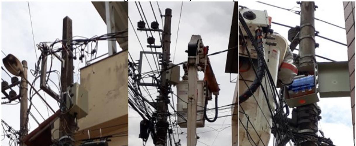
Figura 11 – Instalação em campo

Na figura 11 é possível visualizar a atuação da concessionária instalando a seccionadora de BT nos becos do bairro Beira Rio, no município de Cataguases/MG: