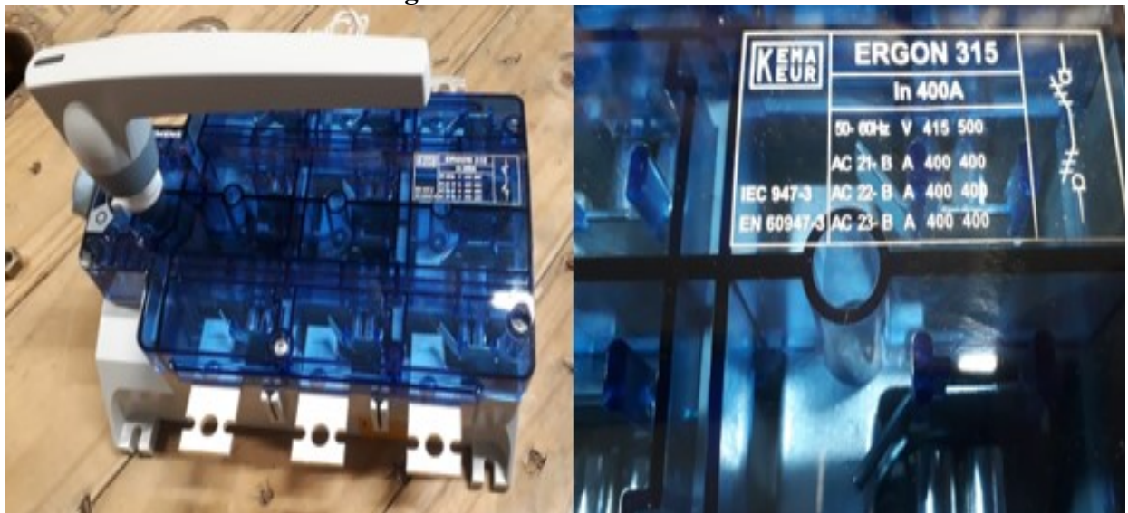
Figura 8 – Seccionador de BT

Nas figuras 8, 9 e 10, destacadas abaixo, são ilustrados os componentes utilizados, o modo de preparação do equipamento (caixa + seccionador) e a instalação em campo.