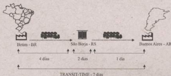
Figura 1: Fases do fluxo de exportação rodoviária – Brasil x Argentina.

Atualmente o modal rodoviário para a Argentina representa 80% dos veículos exportados para esse mercado. Neste modal o fluxo de transporte inicia-se na cidade de Betim/Minas Gerais, sede da montadora com destino à montadora na cidade de Buenos Aires/ Argentina. O Incoterm ( Internacional Commercial Terms ) da operação é CPT ( Cost Insurance and Freight ). Segundo a legislação internacional, trata-se da responsabilidade do exportador os custos referentes ao transporte rodoviário até o destino final, ou seja, Buenos Aires mais o custo de desembarço aduaneiro. O fluxo de exportação rodoviária, conforme Figura 1, demonstra as fases do transporte evidenciando respectivo lead time bem, como o transit-time da operação.