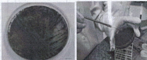
Figura 2. Placa com Pseudomonas aeruginosas

Colônias de P. aeruginosa foram diluídas em salina 0,9% estéril para 108 UFC/mL segundo a escala 0,5 de Mac Farland (BAUER; KIRBY, 1966).