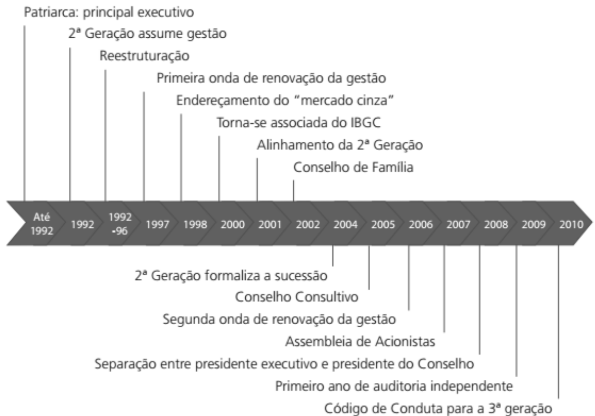
Figura nº: 02 - Evolução da Governança Corporativa da Empresa Fonte: IBGC, 2011

A partir da apuração dos dados pelo IBGC (2011) até 1990 a empresa foi liderada pelo seu fundador; em 1992 os irmãos voltam de suas graduações no exterior e assumem postos de liderança. Com o advento da crise entre 96/97 se tornou necessário à reestruturação da empresa, partindo da mudança de filosofia de trabalho através de um método enxuto valorizando a meritocracia empresarial. Já em 1998 foi definida a formalização das retiradas dos dividendos, na sequência em 2006 ocorria à segunda descentralização e renovação na divisão entre propriedade e gestão. Outra prática incorporada foi a do papel do presidente como moderador das decisões do conselho executivo, cabendo a ele o voto de minerva. Ações estas, que alinham e preparam a companhia para as novas possibilidades da prática gerencial elevando o profissionalismo empresarial. Passos efetivos na prática da sucessão (IBGC, 2011, p. 35-56).